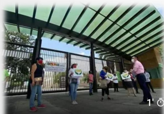
Protesta Diputado junto a activistas: piden que se abra Parque Fundidora

Los directivos del Parque Fundidora, anunciaron su cierre por falta de recursos, dándonos la razón en que el modelo privatizador que impera en el parque, no es sostenible. Es por ello que solicité al Gobernador la apertura y designación de recursos para el parque, así como un auditoria a sus finanzas.