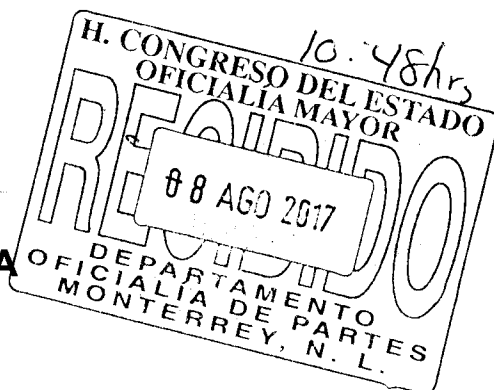
ROSALVA LLANÉS RIVERA DIPUTADA

GRUPO LEGISLATIVO DEL PARTIDO REVOLUCIONARIO INSTITUCIONAL