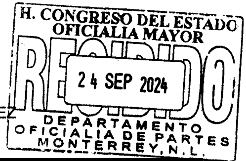
CECILIA SOFÍA ROBLEDO SUÁREZ DIPUTADA LOCAL