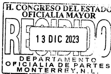
DIP. MYRNA ISELA GRIMALDO IRACHETA