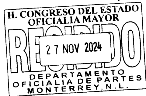
DIP. MIGUEL ÁNGEL GARCÍA LECHUGA