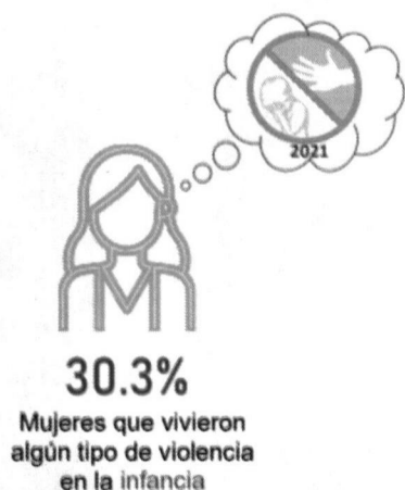
Prevalencia de violencia contra las mujeres de 15 años y más, según tipo de violencia durante su infancia

Información de la Encuesta Nacional sobre la Dinámica de las Relaciones en los Hogares ENDIREH 2021, estima que en el Estado de Nuevo León, del total de mujeres de 15 años y más 30.3 por ciento experimentó algún tipo de violencia en la infancia. Del total de mujeres de 15 años y más, 22.8% vivió violencia física, 13.2% violencia psicológica y 10.6% violencia sexual. Tal como se muestra en la siguiente gráfica 1 :