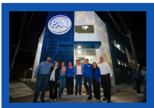
Inauguración del Comité Municipal de Guadalupe