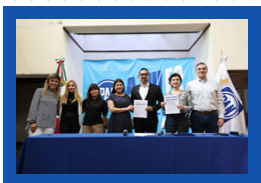
Convenio PAN y universidades para becas y programas