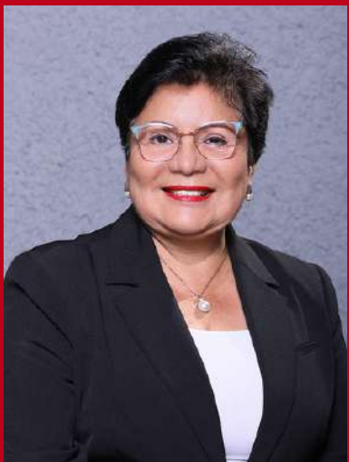
Presidencia de el Comité de Archivo y Biblioteca