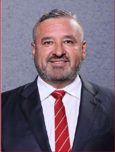
Presidencia de la Comisión de Justicia y Seguridad Pública

En la bancada del Grupo Legislativo del PRI, misma que conformamos 10 diputados, en su mayoría contamos con cargos relevantes dentro de los grupos de trabajo del H. Congreso del Estado de Nuevo León.