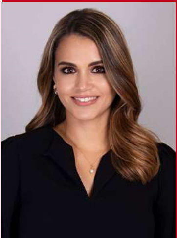
Presidencia de la Comisión Anticorrupción