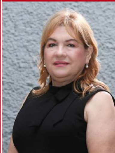
Presidencia de la Comisión de Presupuesto