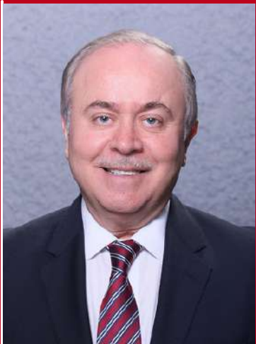
Presidencia de la Comisión de Trabajo y Previsión Social