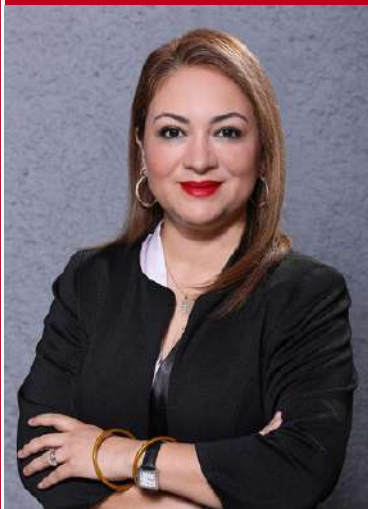
Presidencia de la Comisión Primera de Hacienda