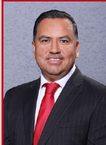
Presidencia de la Comisión Segunda de Hacienda