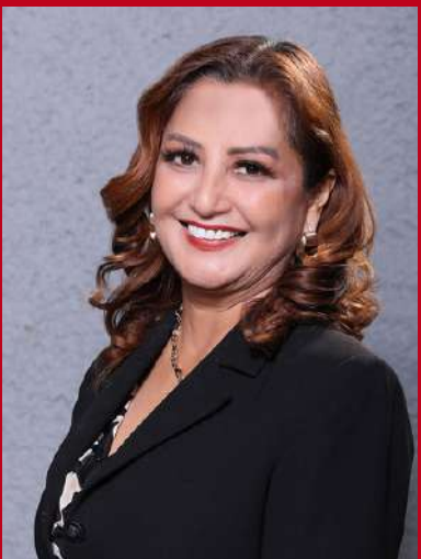
Presidencia de la Comisión de Salud