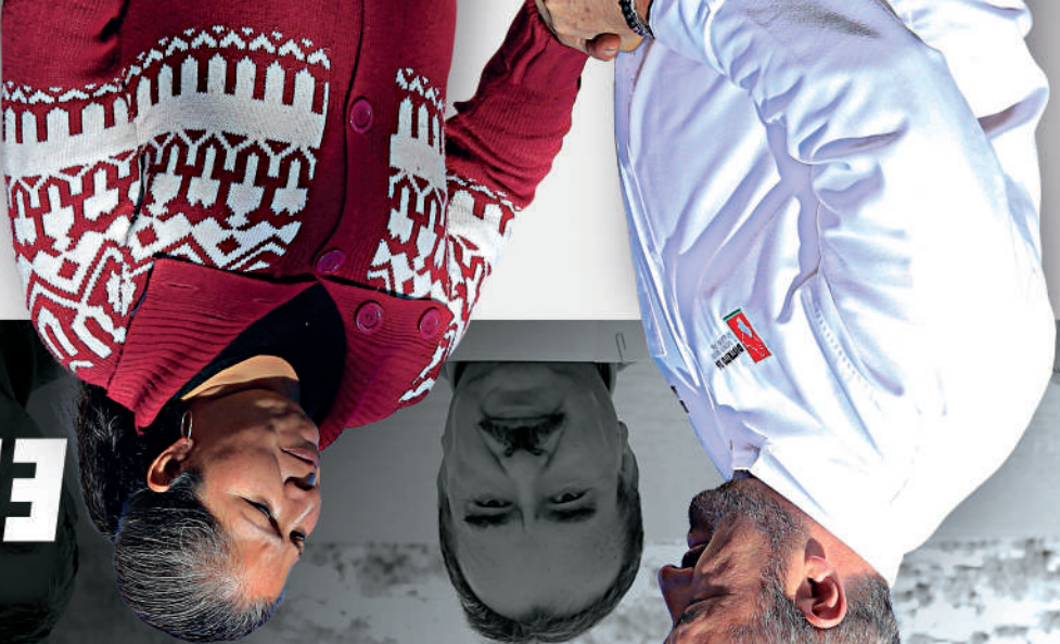
Alejo Pedroza/ Alcalde de Galeana