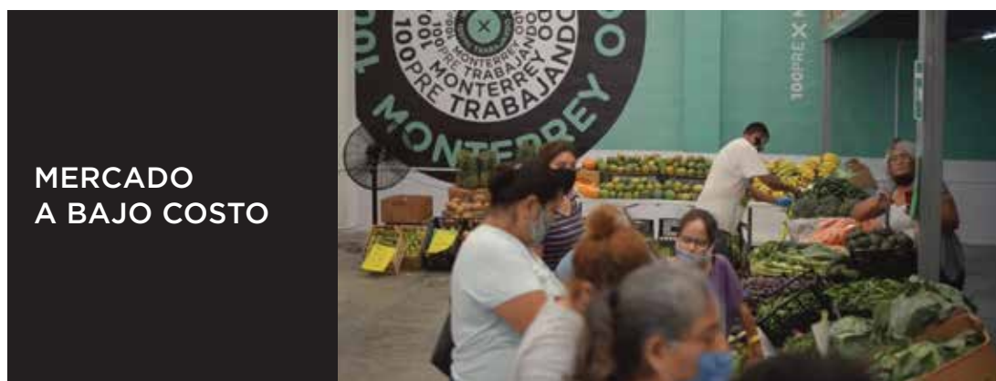
MERCADO A BAJO COSTO

En apoyo a la Educación otorgamos más de 7 mil becas escolares que permitirán a más estudiantes de Universidad y Preparatoria continuar con sus estudios.