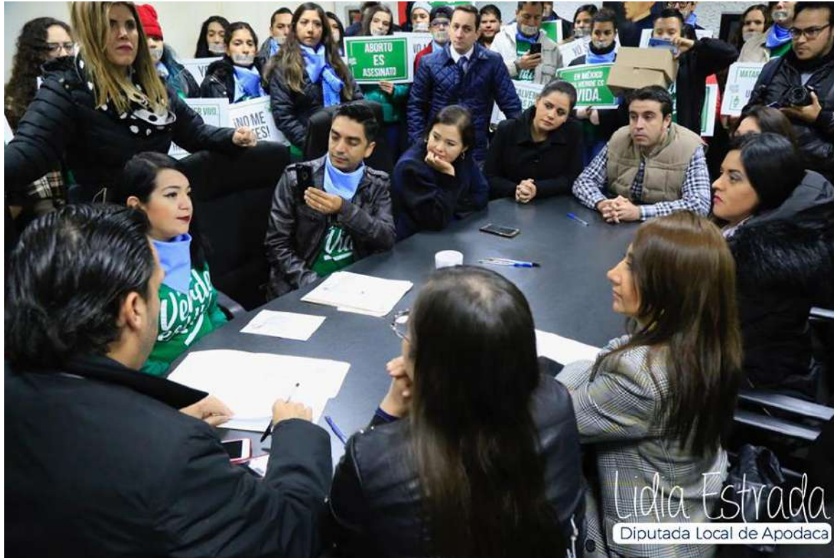
Lidia Estrada Diputada Local de Apodaca