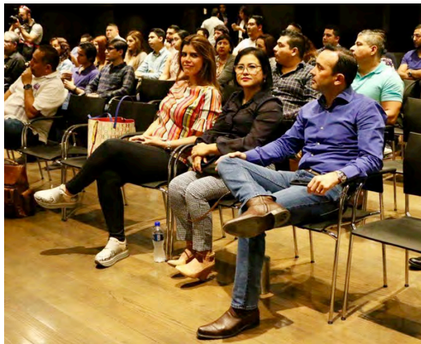
Panel de Movilidad Sustentable.