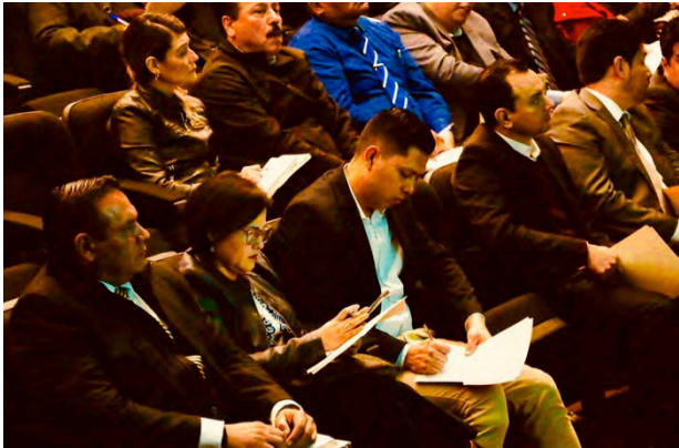
Sistema Nacional Anticorrupción Actores y Responsabilidades.