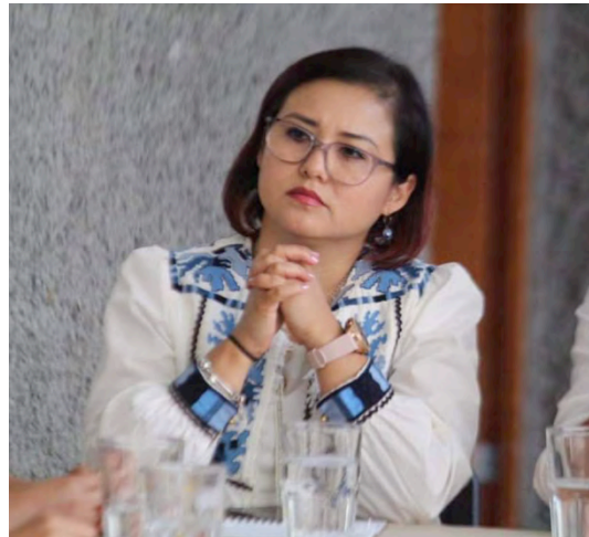
Mesa de trabajo de Bienestar Animal