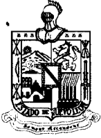
DIP. ALFREDO JAVIER RODRÍGUEZ DÁVILA