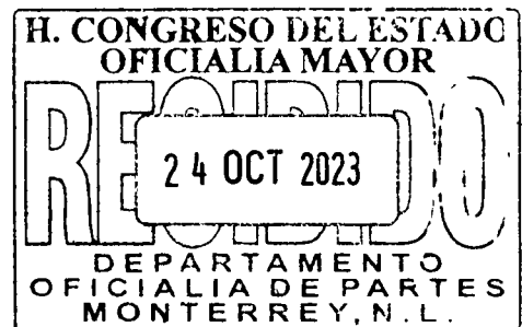
DIP. CECILIA SOFÍA ROBLEDO SUÁREZ