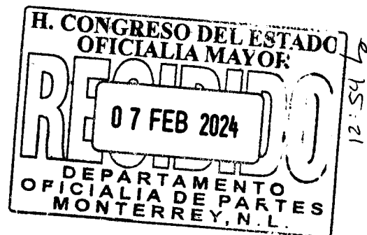
EDUARDO LEAL BUENFIL C. DIPUTADO LOCAL