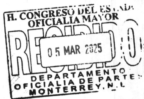
DIP. IGNACIO CASTELLANOS AMAYA