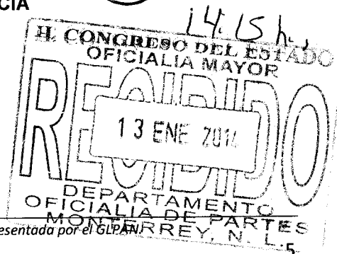
DIR. JUAN CARLOS RUIZ GARCÍA

Atentamente, Monterrey, Nuevo León, Enero 2014. Grupo Legislativo del Partido Acción Nacional